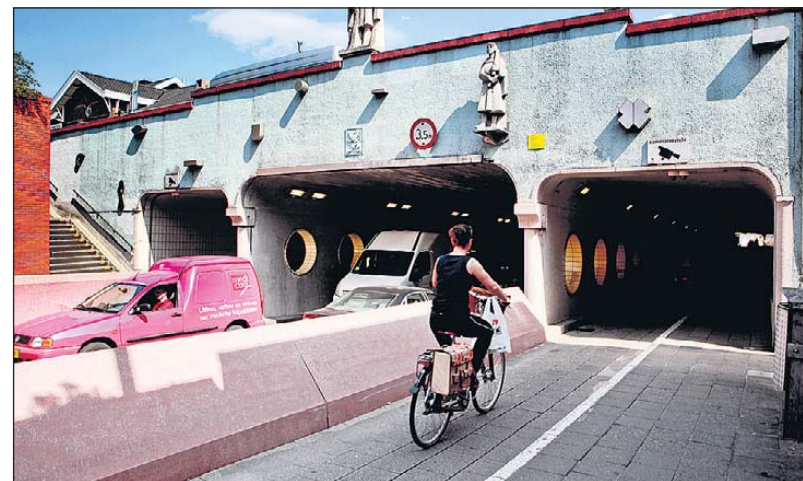
De vier locaties in Roermond waarvoor iedereen ideeën kan aandragen (met de klok mee): het Wilhelminaplein, de Veldstraat, de oude spoortunnel en de parkeergarage achter de Oranjerie.

pers. Ze vragen ieder die de stad een warm hart toedraagt, bijzondere ideeën aan te dragen voor vier bekende aandachtsgebieden in de binnenstad: de Veldstraat, het Wilhelminaplein, de spoortunnel en de parkeergarage achter De Oranje-